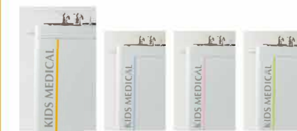
サンイエロー ライトブルー ライトピンク ライトグリーン

カラーバリエーション(イエロー以外はオプションです) 病院内の空間に合わせた配色を取り揃えています。